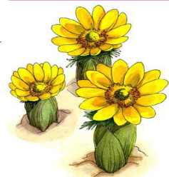
フクジュソウ (福寿草) Adonis ramosa